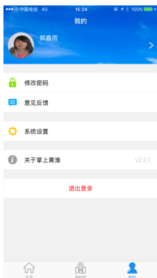
图 4 我的

功能描述：用户维护账号的基本信息；修改密码、意见反馈、系统设置、意见反馈、关于掌上黄誉、退出登录