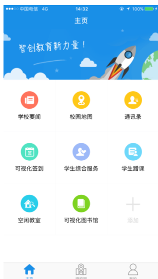
图 2. 主页

功能描述：用户输入用户名和密码以后会自动转到通知页面，在本页面可以查看、学校要闻、校园地图、通讯录、可视化签到、学生综合服务、学生蹭课、空闲教室、可视化图书馆。