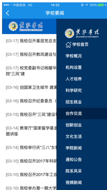
图 2. 学校要闻

学校要闻：学校首页、学校概况、机构设置、人才培养、科学研究、招生就业、合作交流、创新创业、文化生活、学院新闻、通知公告、院系风采、视频新闻、媒体黄淮。