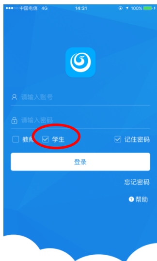
图 1.2 账号登录

软件安装成功后，点击软件图标，即可运行软件。软件运行后进入软件登录界面，输入有效帐号和密码，勾选 [学生] 点击 [登录] 按钮，如所示图所示一般学生都是由管理员从后台加入系统的无需自己注册)