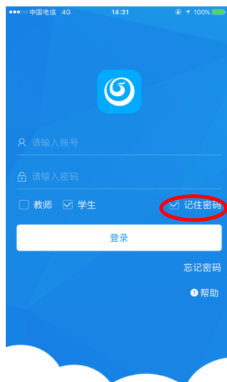
图 1.5 记住密码