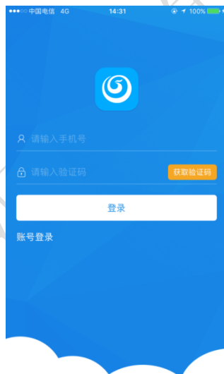
图 1.3 手机号登录