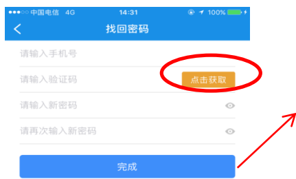
图 1.4 忘记密码