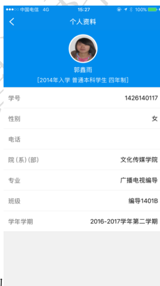
图 4.1 个人资料