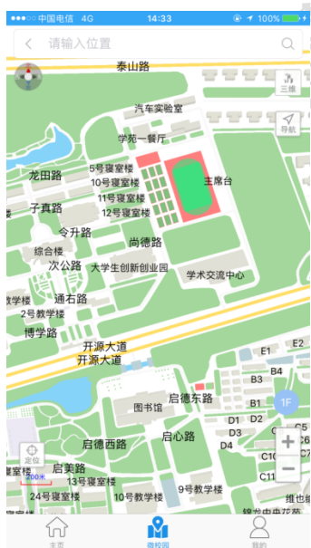
图 2.1 校园地图