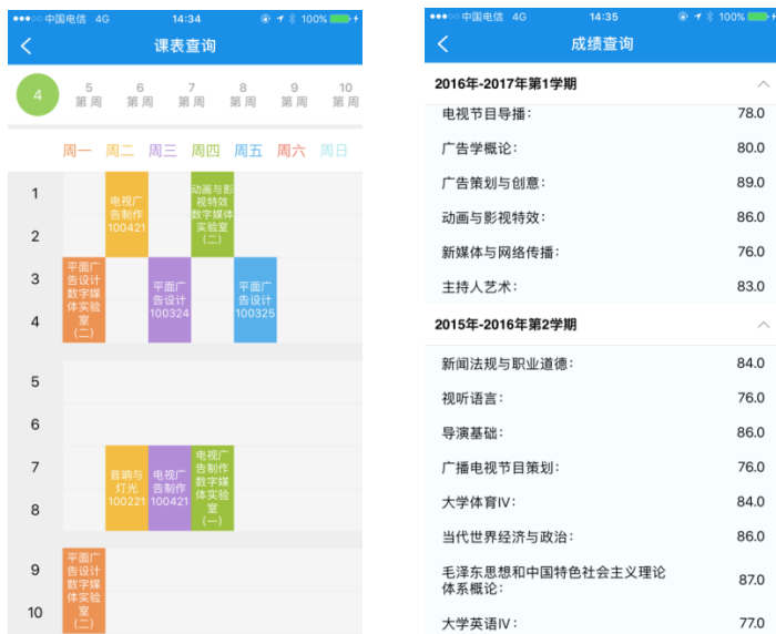
图 2.4 课表查询、成绩查询