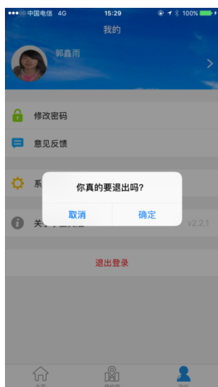
图 4.6 退出系统

点击‘我的’底部‘退出登录’按钮，跳出相应的提示‘你真的要退出吗’点击‘确认’直接退出；点击‘取消’，返回当前页面。