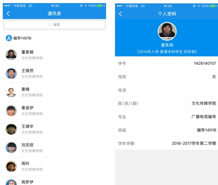
图 2.2 通讯录

功能描述：查看学生的个人资料、学号、性别、电话、院（系）（部）、专来、班级、学年学期。